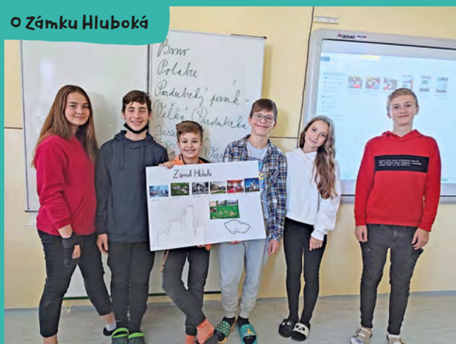
o Zámku Hluboká