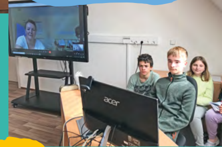
Azda sa raz stretneme...