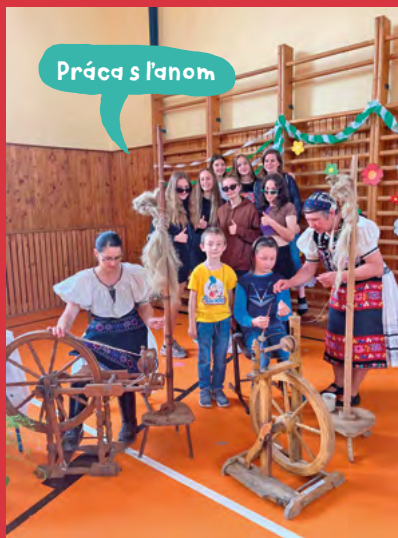
Práca s ľanom