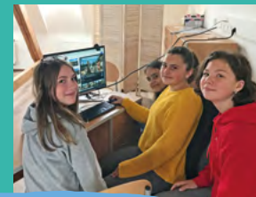
Kým to šlo len na diaľku...