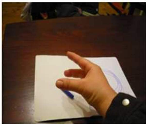
tieto tri prsty držia pero nácvik toho aby ostatné prsty nezavadzali