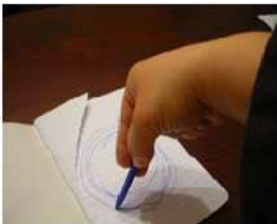
nácvik správneho držania pera