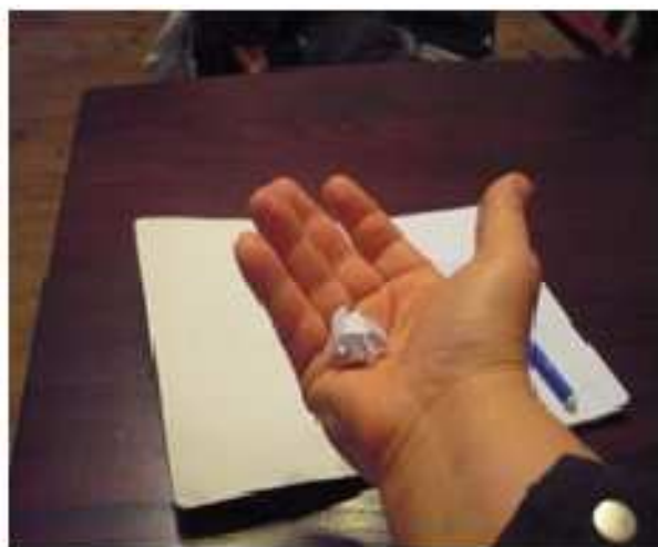
urobíme papierovú guľičku