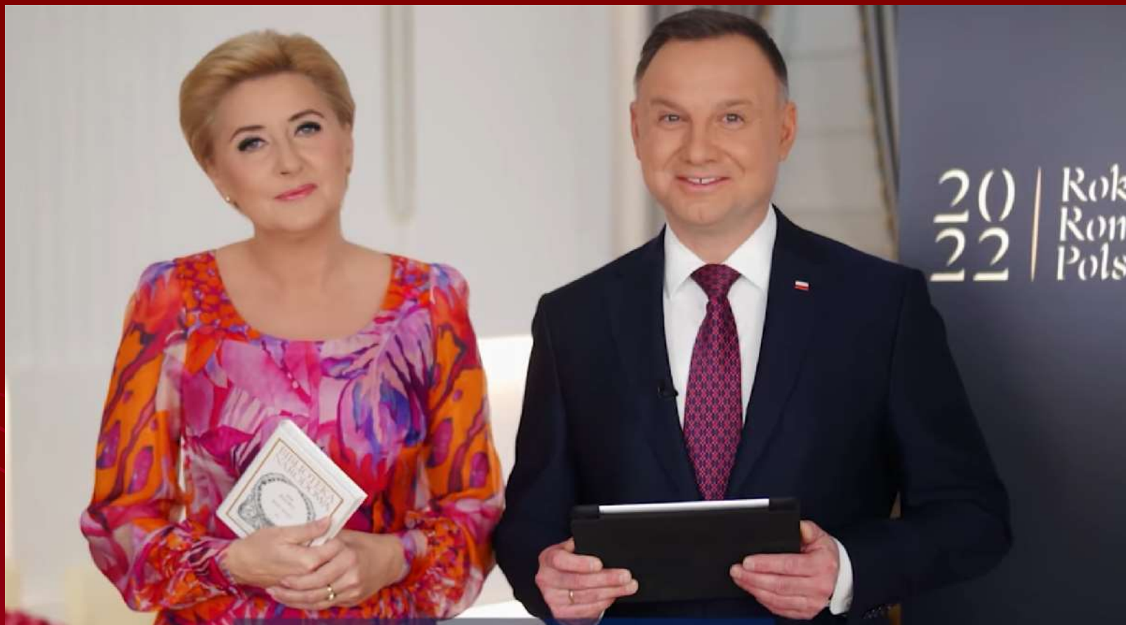
Andrzej Duda – Prezydent RP z żoną Agatą Kornhauser–Dudą